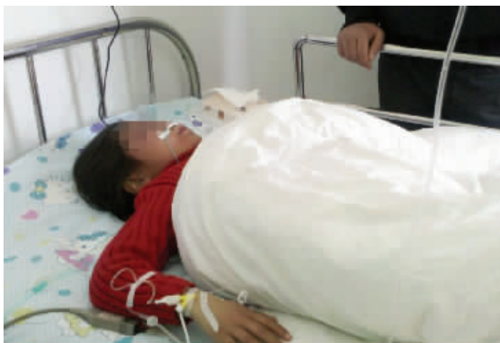
受伤最重的小成还在接受治疗