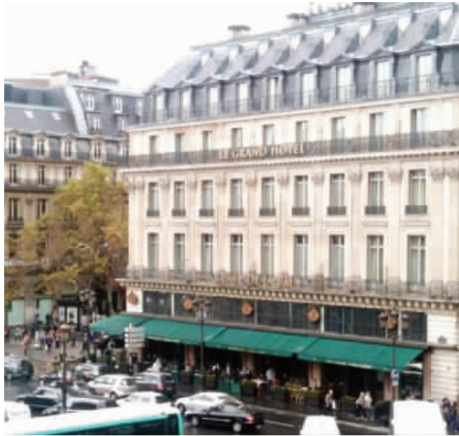
五星级巴黎洲际大酒店