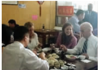
拜登在北京吃炸酱面

2011年8月18日,正在中国进行正式访问的美国副总统拜登一行,中午忙里偷闲,兴致勃勃地到北京鼓楼附近品尝北京小吃。