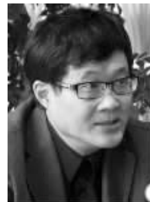
吕澎 著名批评家 策展人

TEFAF的2012市场报告在对拍卖市场、画廊、古董商及其他形式的私下交易现状进行了详尽的分析后,得出结论,拍卖市场占全球艺术品市场的份额为48%,古董商、画廊及其他形式的私下交易占52%。所以,把一级市场和二级市场的的数据结合起来,这样的统计方式对市场的反映更全面。