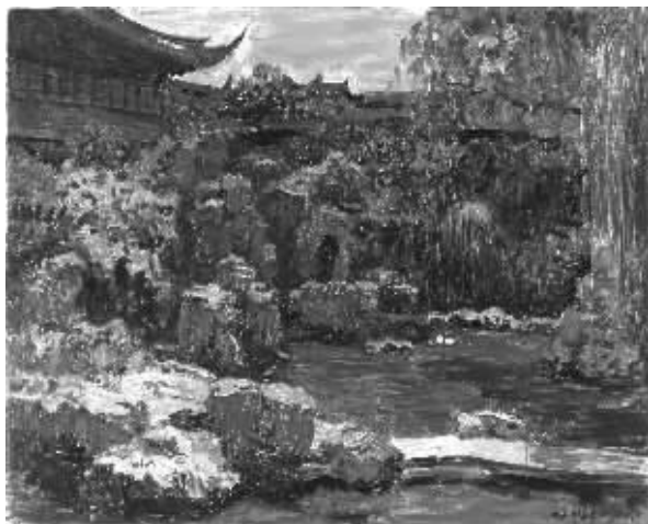
周春芽《上海豫园小景之一》