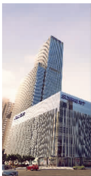
新街口见证了苏宁集团的崛起

建设标准完全参照国际人居标准的尊崇感,荟萃了国际顶尖品牌,打造品质优异的家装。从厨卫到客厅,大至空调,小至开关,皆以国际名品为配置标准,甄选了汉斯格雅、博夫曼、西门子、摩恩、科勒、大金等品牌精装。”苏宁悦悦置业顾问介绍到。除此之外,苏宁悦悦还“坐享其成”13万㎡都市综合体内的“线上+线下”的极速生活外,出门就是新街口。(胡海强)