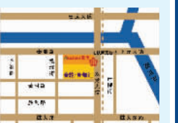
金轮新都汇区位图

金轮地产意向专注打造房地产精品。从金轮国际广场到金轮华尔兹等精品楼盘曾经掀起抢购狂潮, 优秀的产品品质奠定了金轮的品牌实力, 也使其产品价值不断攀升。而金轮新都汇对于购房人来说无疑是抢占财富通道的难得机遇。其升值潜力值得期待!