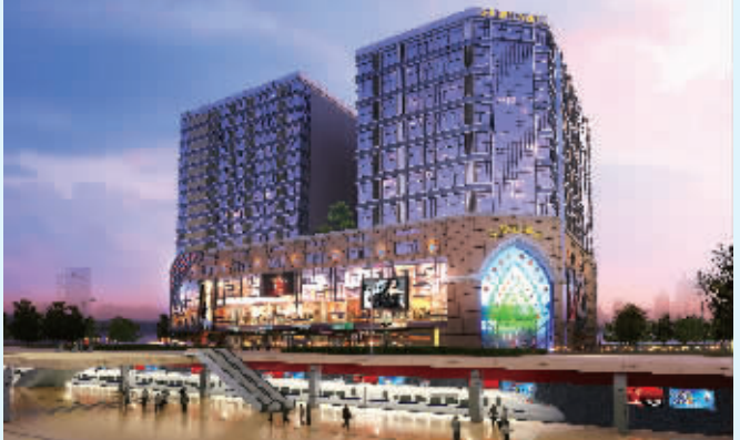
金轮新都汇项目效果图

而“零距离”地铁物业拥有的完善发达交通系统使金轮·新都汇地理位置的优越性得到进一步彰显。一方面, 无缝对接地铁, 直达新街口, 对接中心繁华; 一方面, 经过两站即为亚洲第一站——高铁南京南站, 给生活出行、工作差旅带来极大便利。外有多条公交线路, 贯穿城市的每一个走向。金轮·新都汇还因其位处双龙大道与董村路的交会处, 带来私家的便利。城市主干道掌控城市交通命脉, 道路宽敞开发, 为私家出行带来轻松的便利。