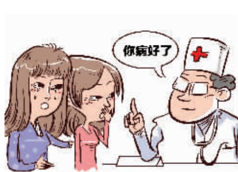
►“妹妹”的胃癌神奇地治好了 漫画 俞晓翔