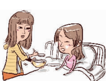
►五年精心照料不离不弃