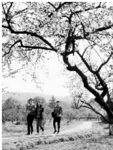
白马涧的梅花开得正盛