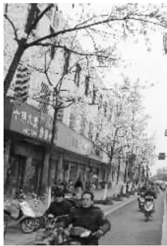
十梓街的白玉兰堪称苏城一景

记者从苏州市绿化部门了解到, 春季开花的植物今年普遍较前两年提前露出笑脸, 且长势很好。