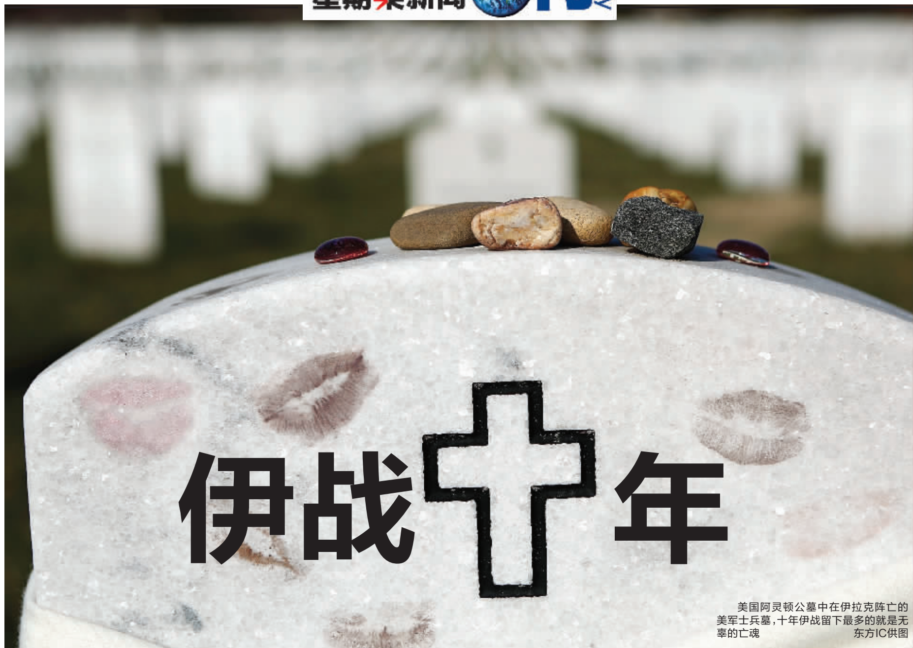
美国阿灵顿公墓中在伊拉克阵亡的美军士兵墓,十年伊战留下最多的就是无辜的亡魂

2003年3月20日,美国发动了伊拉克战争。从那一刻开始到今天,伊拉克乃至中东格局都发生了变化。时光荏苒,光阴如箭。今天,距离伊拉克战争十周年的纪念日只有3天时间,许多的问题依然萦绕着我们。