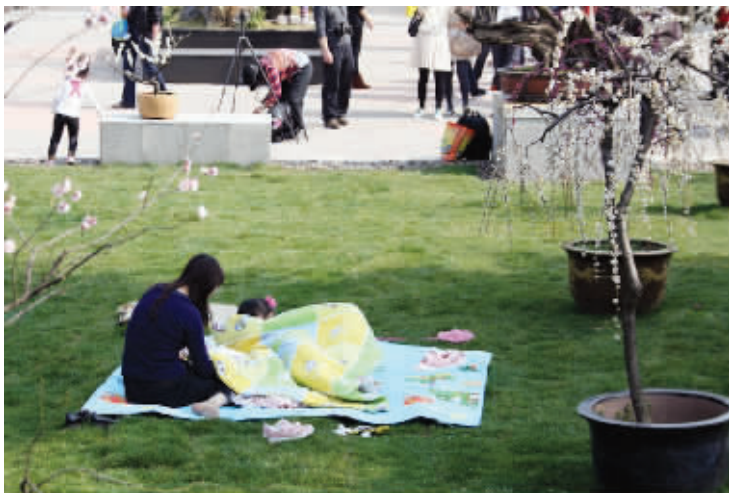
“全副武装” 居然有人带着铺盖来赏梅。没办法,谁让咱南京的天气是四季随机播放呢?冷风说来就来,冷了随时钻被窝。3月9日摄于梅花山