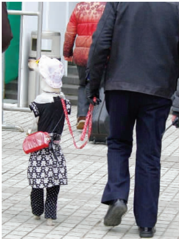
春天来了,主人带我出门,春游去啦。不过主人说,一定要站着走,不然会糟蹋了这身好衣服。3月1日摄于新街口