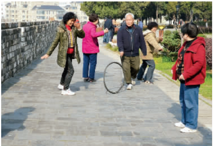
收放自如 老爷爷滚着自行车轮胎,在人群中自如地穿梭。只会滚铁环和连铁环都不会滚的孩子们,你们惭愧不? 3月15日摄于八字山