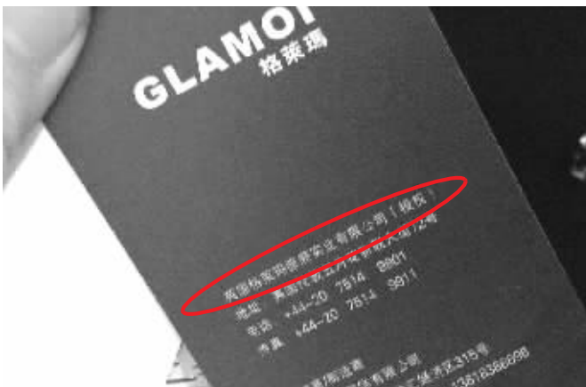
服装吊牌上写着英国格莱玛公司授权 现代快报记者 陈露露 摄