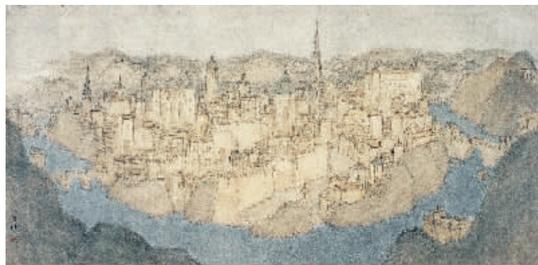
常进《神秘的托莱多古城》