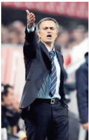
抽到好签,穆里尼奥有望带领皇马走得更远