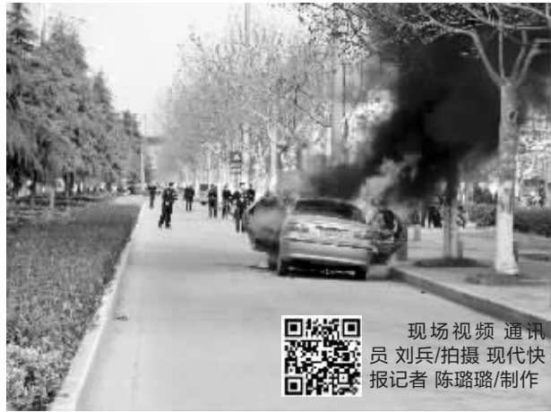
现场视频 通讯员 刘兵/拍摄 现代快报记者 陈璐璐/制作

能明确标出实测容量和标注容量间的差别,可能会避免一些汽车加油方面的纠纷。不过,据他所知,目前国内外都还没有这方面的标准规定,这确实可以作为一个问题来探讨。南京市计量监督检测院还对其他10款车型的油箱做了检测。朱光提醒,这些试验数据只是根据样品得出来的,实际情况千差万别,比如油垢影响容积等,市民最好是按照使用习惯来加油。