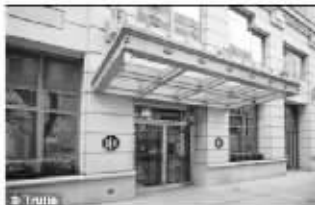
费雷尔原本看中的价值190万美元的豪宅内外