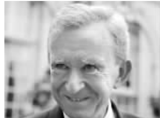
法国首富伯纳德·阿诺特

据英国《每日邮报》报道，针对法国总统奥朗德不断增加的对超级富豪的征税力度，法国达索公司老板伯纳德·查尔斯有意加入逃离法国的队伍，移民英国。