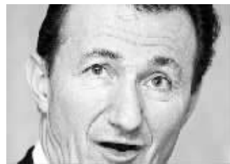
达索公司老板伯纳德·查尔斯