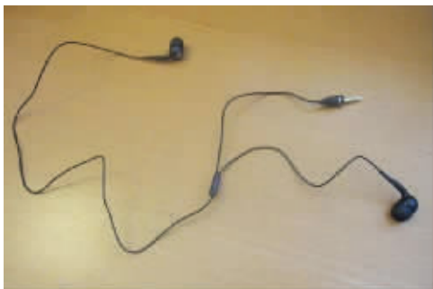
买了个耳机,感觉不对劲