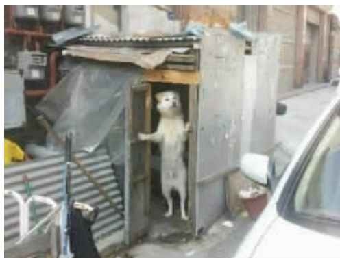
外面啥事大惊小怪的?