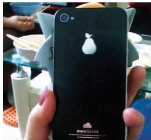
浓郁的山寨风扑面而来