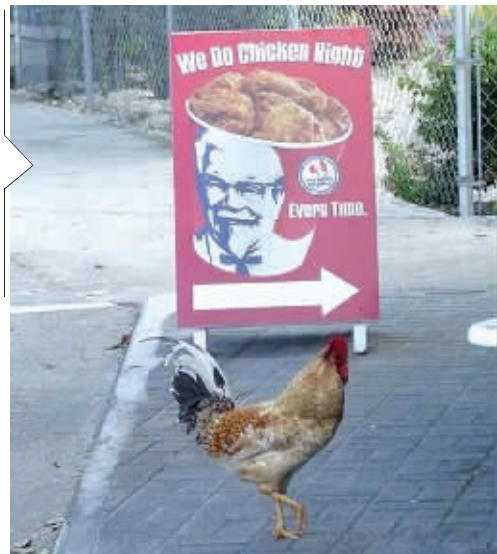
你这是自寻死路啊