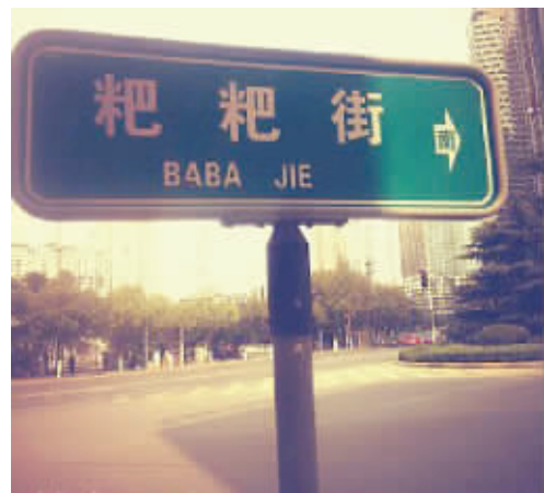
走路时一定要小心脚下