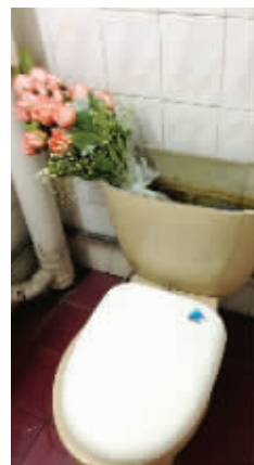
家里没花瓶,那就这样吧