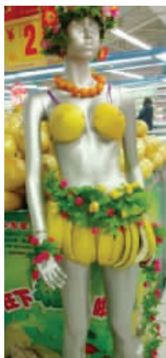
超市大妈又逆天了