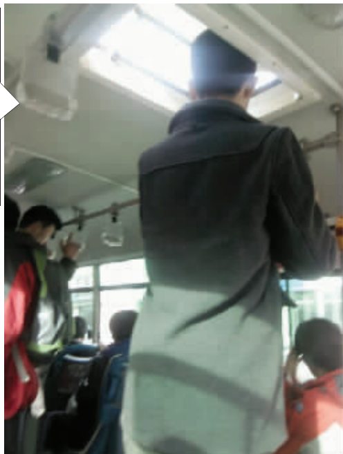
大哥,你赶上长颈鹿了