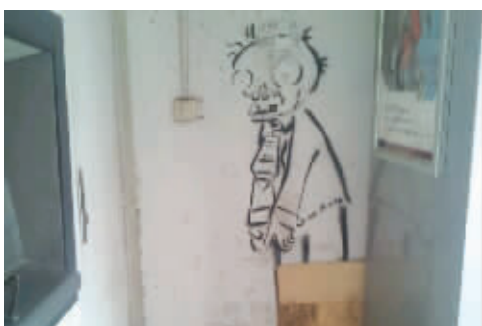
谁在取款机旁画的,太吓人了