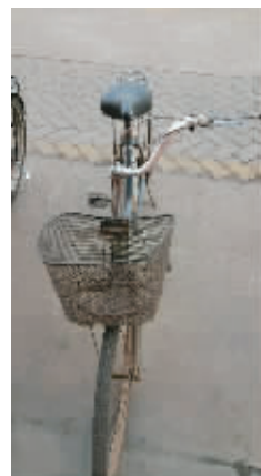
独臂刀王的自行车