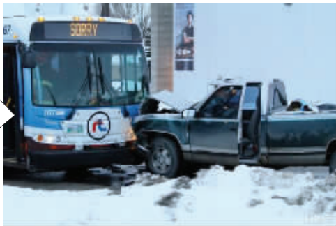
这辆公交车很有礼貌呀