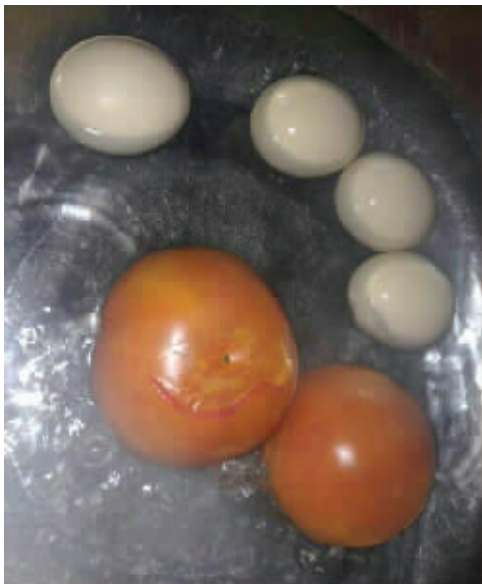
史上最懒的西红柿鸡蛋汤