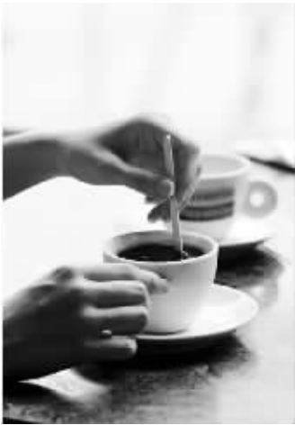
喝咖啡和装文艺到底有没有关系

我和她去的时候都点甜的那种,个人不喜欢苦味。她第一次看到我点甜的,就说:你太不懂咖啡了,太不懂了太不懂了太不懂了……我问她,她也不告诉我,就一直像复读机一样重复:不懂啊太不懂了……后来,我还是点了甜的,她说,给我尝尝,然后就把我的喝光了。再然后,把美式咖啡推到我面前,苦得我牙都快掉了!