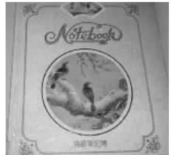
尹女士珍藏的日记本