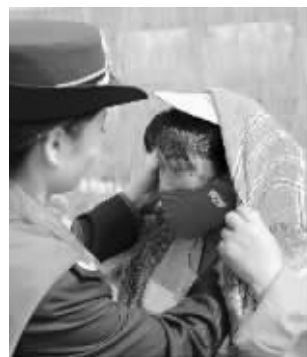
帮养护工戴上口罩

快报讯(通讯员 孙逸飞 记者 毛丽萍)昨天是三八妇女节,南京宁马公路上的养护工们却像往常一样,穿上橘黄色工作服,戴上橘黄色工作帽,头上围着花头巾,再套上橘色反光背心,在高速上扫地,捡拾垃圾。“我知道今天是三八节,但是农村人不过这个。”可是当江南站女子路政中队和科研所女子检测所的女同胞们放弃休息,和她们一起拿起扫把,为她们戴上防尘口罩时,她们开心地笑了,“还是女人懂得爱护女人。”