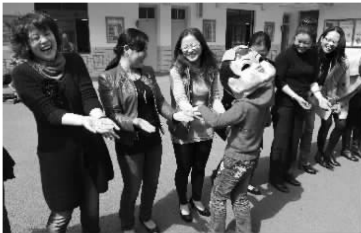
摸摸看,哪双手是妈妈的

亲子游戏让她们在自己的节日里流下幸福的泪水 感动过后,首先想到的是忙着回家给儿子炖牛肉