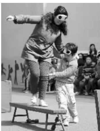
扶着妈妈过“独木桥”

肚子上绑着八斤重的沙袋,还要传球;用乒乓球拍传鸡蛋,不能掉地……昨天中午,南京赤壁路小学72名二年级学生,在操场上玩着特别的亲子游戏,体味妈妈孕育他们的辛苦,照顾他们长大的小心翼翼。八九岁的孩子,也懂得用自己的方式回报,在游戏“摸手找妈妈”中,大多数孩子找到自己的妈妈;在“盲人旅行”中,儿女搀着蒙住眼睛的妈妈,安全走过独木桥……孩子们的贴心让妈妈们在自己的节日“三八”节这天,流出幸福的眼泪。