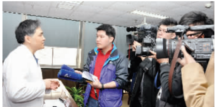
南京医科大学附属友谊整形外科医院院长吴国平博士国家卫生部整形外科内镜与微创学术大会新闻发布会现场接受记者采访