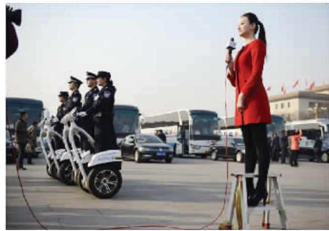
3月5日, 第十二届全国人民代表大会第一次会议在北京人民大会堂开幕。这是一位记者站在梯子上出镜, 与身旁执勤的警察相映成趣。新华社记者 王鹏 摄