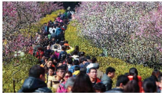
梅花山景区游人如织

快报讯(记者 曾德 通讯员 钟萱)昨天,艳阳高照,不少市民按捺不住出游的心,一家老小上阵,上梅花山赏梅去。据中山陵园管理局介绍,双休日两天共迎来8万赏梅游客,其中周日占了5万。