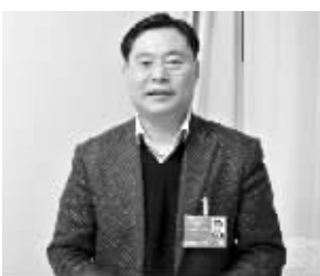
全国人大代表周学东

这两天，关于“国五条”细则，谈论最多的是“卖房所得按20%征个税”，但最让人觉得心悬的，是二套房首付比例和贷款利率可能上调。