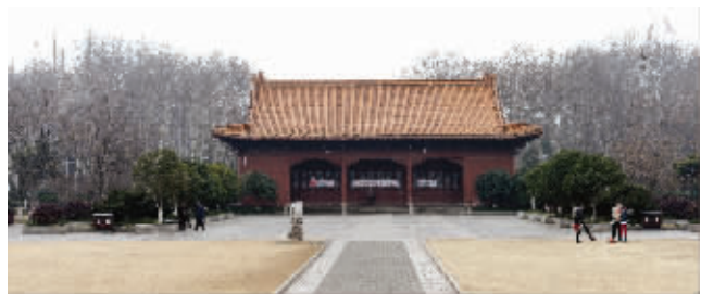
南京明故宫。清代,这里是江宁驻防城所在地,有很多满族将士和眷属居住

民国时期,作为首都,南京接纳了很多前来学习、交流的蒙古族同胞。当时南京的国立边疆学校,就有不少蒙古族的学生。