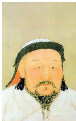
元世祖忽必烈画像。元朝,很多蒙古族将士和居民进入江南

江苏的55个少数民族分布在全省13个市,超过千人的少数民族有25个,其中超过万人的有10个;100人以下的有15个。从统计数据来看,城镇少数民族居多,有262584人,约占68%。少数民族人口最多的是南京市,有10万左右。