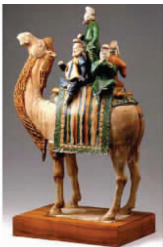
唐三彩中的胡人形象。唐宋时期,江南也有很多西域商客