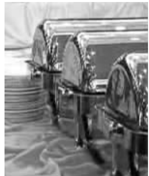
没有宴席,吃自助餐 视频截图