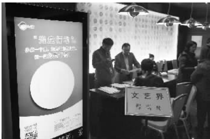
北京铁道大厦全国政协委员报到处旁放着“光盘行动”公益广告牌,呼吁人们少点一个菜,为贫困山区儿童捐赠免费午餐 新华社发