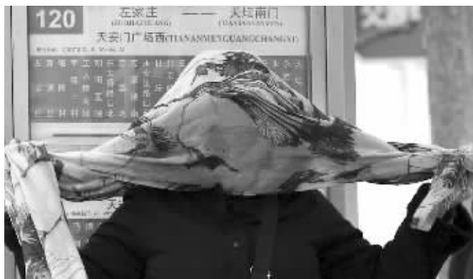
等公交的市民脸裹围巾防沙尘 中新网图