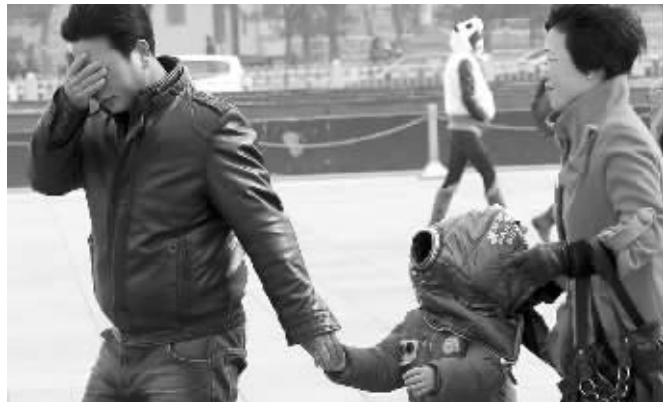
天安门广场,大人用衣服把孩子的脸护住