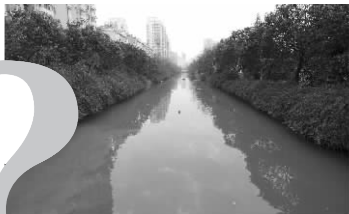
异味源不用寻找,就是这条黑臭河

后经相关部门协商,泵站恢复正常运转。去年国庆前,里圩河的黑臭情况稍稍改善。但生活污水仍在排放,治标不治本。