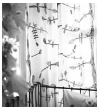
春天到了,给家换装吧

当我们给自己和家人购置靓丽的春装时,别忘了给家居也添点新色彩。靓丽的窗帘、绿色的植物、绚丽的床品……简单几件单品就能将春天的气息悄然迎入家中。是什么让家充满活力?其实并