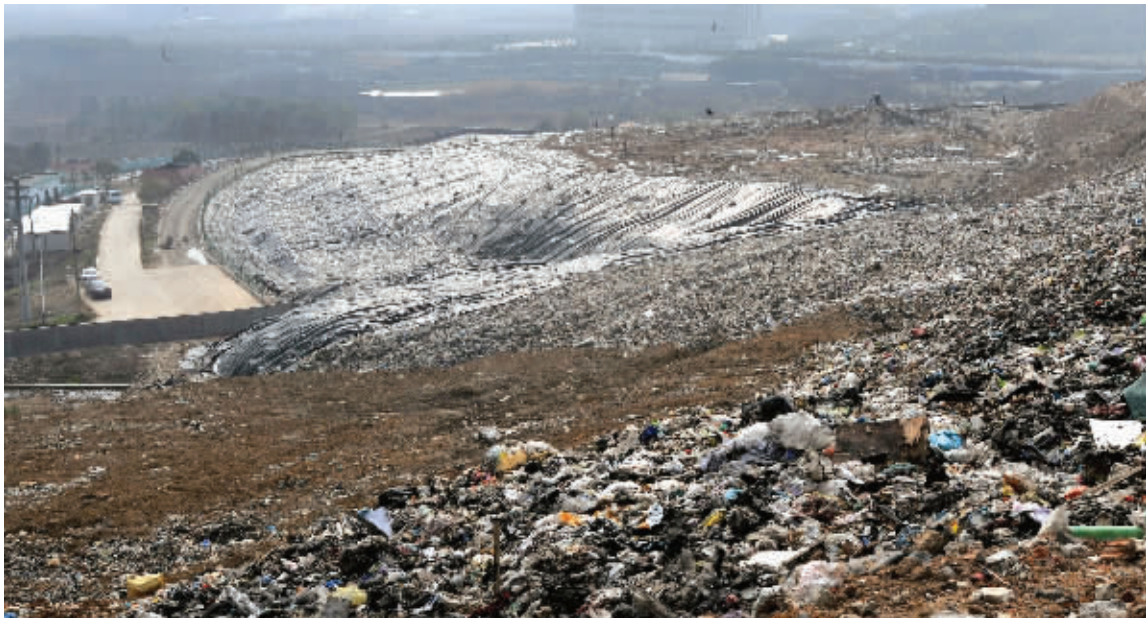
水阁垃圾场的2号库,已经做了隔水处理,将要进行覆土掩埋