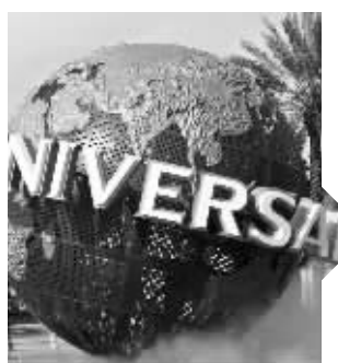
环球影城 资料图片

蛇年伊始,受房地产调控预期影响,地产板块节节走低。2月26日,地产指数收于3544.50点,较新年第一个交易日的开盘指数已跌去9.2%,与金融板块一起领跌年后大盘,“招保万金”等地产龙头股无一幸免。蹊跷的是,华业地产、中国武夷、新华联等三只地产股却集体躲过了本轮调整。值得注意的是,上述公司尤其是前两者均在通州有储备土地和房产项目,而近日美国环球影城将落