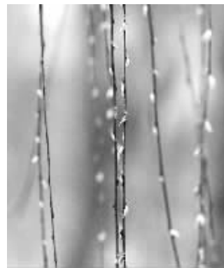
柳树冒出新芽