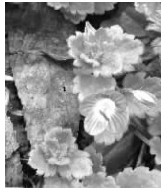
婆婆纳开花了

市民想要看到桃花,还要再等待一个月,“一般每年3月下旬到4月上旬,桃花才会盛装绽放。”