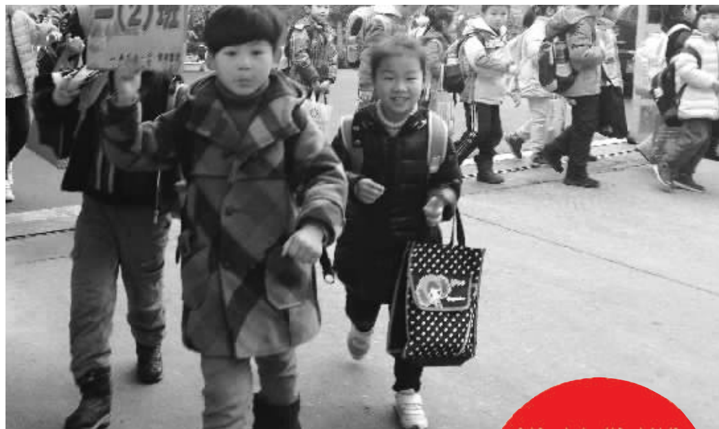
晚上学半小时,局小一、二年级学生很开心 现代快报记者 晁静 摄