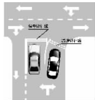
停车让行,减速让行

当由支路驶上干路又没有信号灯指示的情况下,往往会遇到让行问题:1. 停车让行。是指车辆遇到“停车让行”标志时,要先在“停车让行线”前停车,进行瞭望,确认安全后,方可通行。2. 减速让行。是指车辆在遇到“减速让行”标志时,车辆驾驶人应慢行或停车,观察干道车辆情况,在确保安全的前提下,方可进入路口。