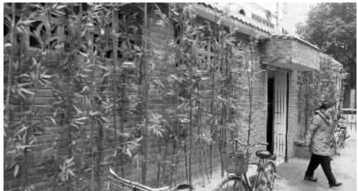
建邺路菜场公厕