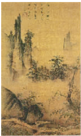
与当下的艺术比较,传统画作似乎更符合中国人的审美。图为宋代马远《踏歌图》