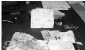
遗落在出租车上的钱物