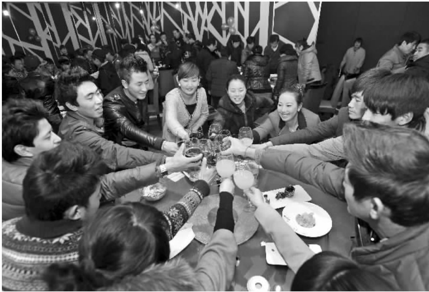
春节聚餐要“光盘”已经成为新的时尚