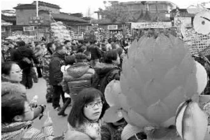
春节期间,夫子庙景区游人如织

161.3亿元 ——长假期间江苏消费总额 12.6% ——长假期间江苏交通事故比去年大幅减少 75.1亿元 ——长假期间南京消费总额 115套 ——长假期间南京新房认购量 357万人次 ——长假期间南京接待的游客数量