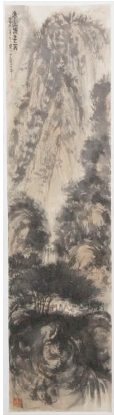
被指为假的展览作品