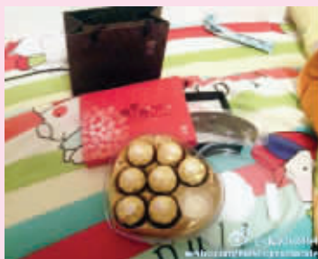
@-kzy962464:情人送的,好基友好丽友,我爱你哈哈,提前收情人节礼物了。