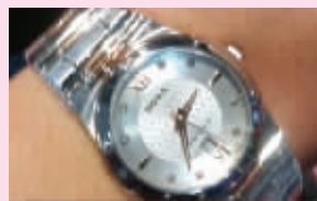
@额图V:买了块瑞士时度送老婆当情人节礼物。