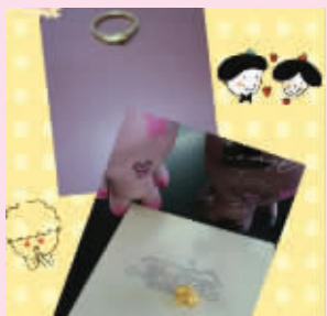
@shanshan0407:提前收到情人节礼物,有戒指有吊坠,有图有真相。