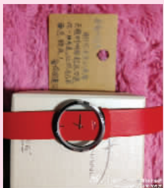
@Luyisa是老公最宝贝的小东西:老公的情人节礼物~弄得我好幸福啊!哈哈~

我们都知道物质不能买来爱情,但有情人依然愿意在情人节这天将心中满满的爱意化为实物,表达自己的一片真心,不少网友在微博上大晒礼物,引发各种祝福感叹,“1314”这独特的一天,每一份真诚的爱情都值得细细珍藏妥善安放。