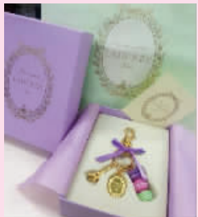
@IT小摇摇:美女送我的情人节礼物,真好看嘻嘻~粉蓝,粉紫真美!有机会去法国吃这家马卡龙。