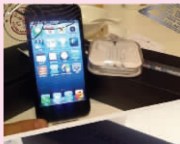
@viva靓靓:To 某人。情人节礼物。我是不是有点奢侈。