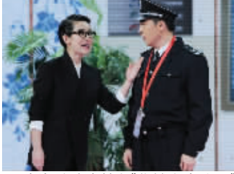
秦海璐孙涛献上《你摊上事儿了》