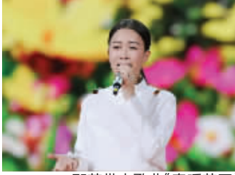
那英带来歌曲《春暖花开》