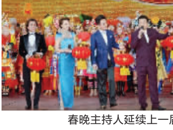
春晚主持人延续上一届