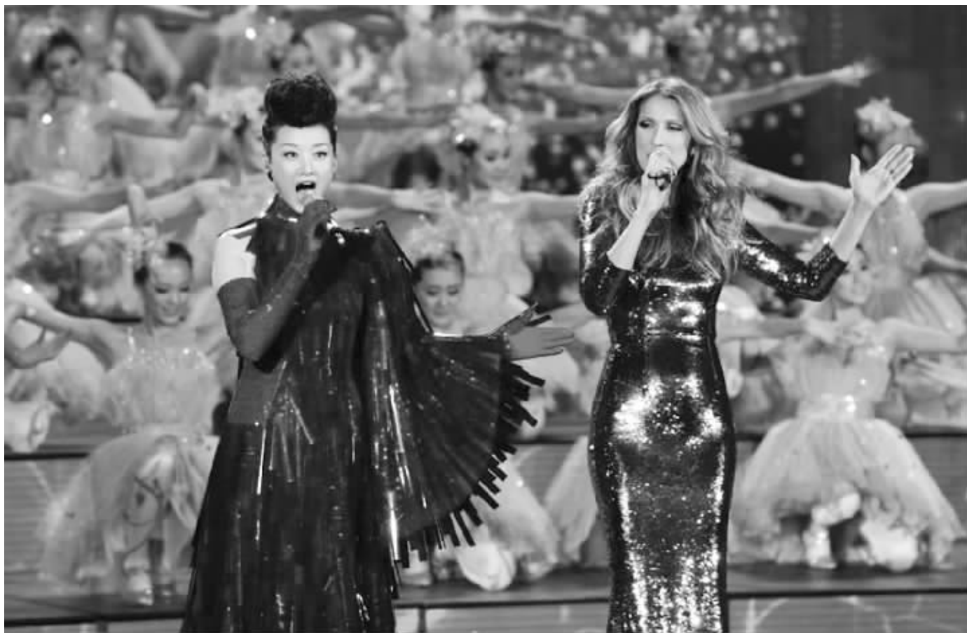
宋祖英和席琳·迪翁混搭合唱是蛇年春晚的一大亮点

孙俪与李健带来了歌曲《风吹麦浪》,平安再度献唱了《我爱你中国》,曲婉婷与杜淳带来了歌曲《我的歌声里》,而《high歌》则出现在了蔡明与潘长江的小品里……看来今年哈文彻底抓住了2012的流行元素,要去争取更多的年轻观众。