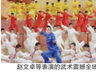
赵文卓表演的武术震撼全场