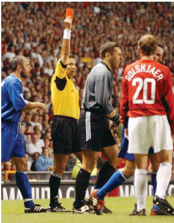
2002年的那场比赛,萨拉耶格斯泽格TE的门将被红牌罚下