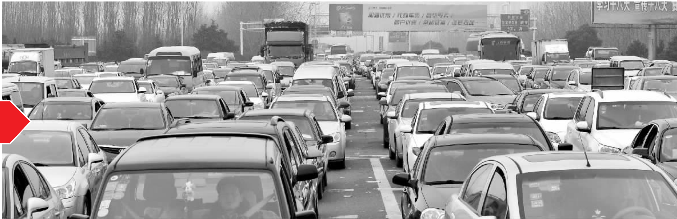
昨天下午, 二桥收费站出城方向汽车排起长龙

@荒野七人: 9点开车, 1点半才到老家, 多花了近两小时。车流移动速度堪比高峰时的内环高架啊!