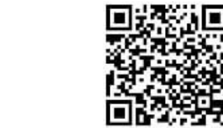
扫描二维码看高速公路拥堵情况

刚疏通, 一会又堵起来了, 长江三桥不得不根据情况间断地免费放行。16:59, 长江三桥虽然在免费放行中, 但是车辆却上不了宁合高速, 堵过收费站, 堵过了引桥。“桥面上快成停车场了。”三桥相关负责人透露, 他们及时与江南相接的绕城高速进行了联系, 在绕城高速上的“情报板”上打出: “宁合高速拥堵, 三桥不畅, 请有条件的车主选择其他过江通道通行。”网友“小小的水滴”抱怨: 堵车堵了一个多钟头, 刚到长江三桥, 又堵上了! 现代快报记者了解到, 昨天长江三桥的车流量超过了7万辆, 每辆车平均过桥需要耗时1~2个小时。