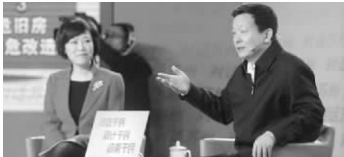
《对话苏州》节目现场,苏州市委副书记、市长周乃翔(右)与百姓“面对面”交流