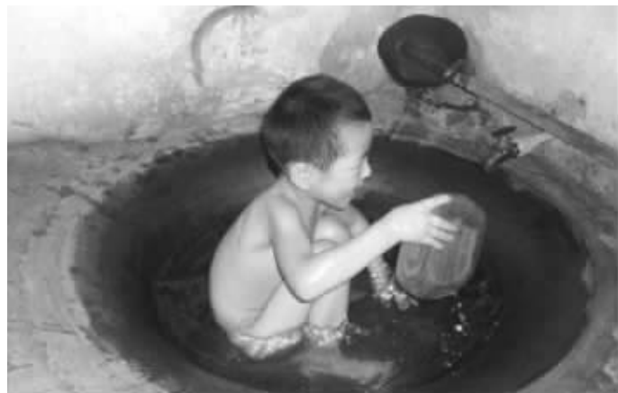
小朋友正在“浴锅”中洗澡

网友“燃烧绳名”告诉记者，她外婆家在苏州张家港，在她印象中，童年时外婆家中就有一口专门用来洗澡的大锅。“跟麻将桌差不多大，大人也可以坐进去洗，就是不能伸开腿。”她说，锅上面还有个水龙头可以放水，感觉特别神奇。