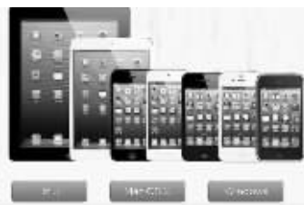
evasi0n官网完美越狱界面

记者在新浪微博上看到，很多中国的网友也正在守着这一刻，越狱程序包发布后立刻引来众多下载。但因下载的人太多，很多网友下载失败。据称，iOS6.1完美越狱发布后10分钟，越狱工具evasi0n的下载量就达到了10万，这还是在