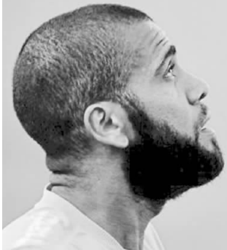
巴西男足不会给英格兰队添堵