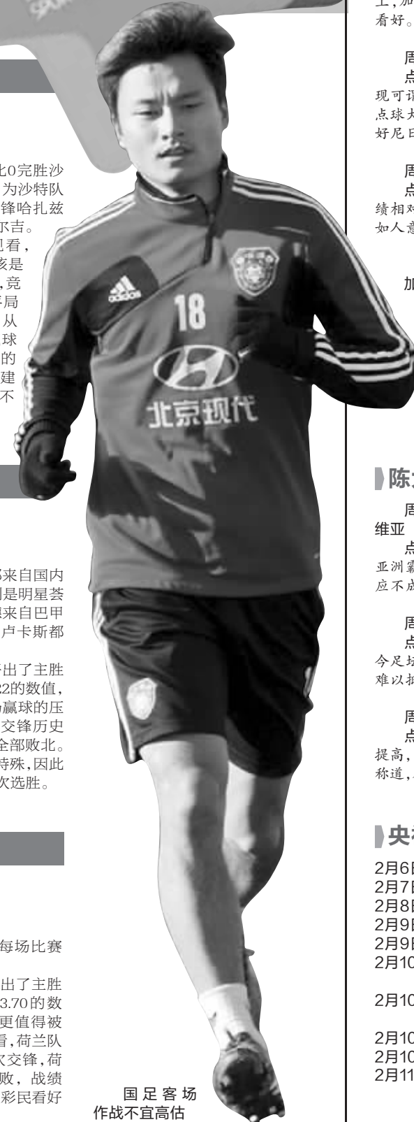
国足客场作战不宜高估

本场比赛,竞彩网开出了主胜1.86、平局3.20和客胜3.70的数值,从数据上看荷兰队更值得被看好。从双方的交战来看,荷兰队明显占据优势,近期几次交锋,荷兰队在主场连续五场不败,战绩为3胜2负。鉴于此,建议彩民看好主队。