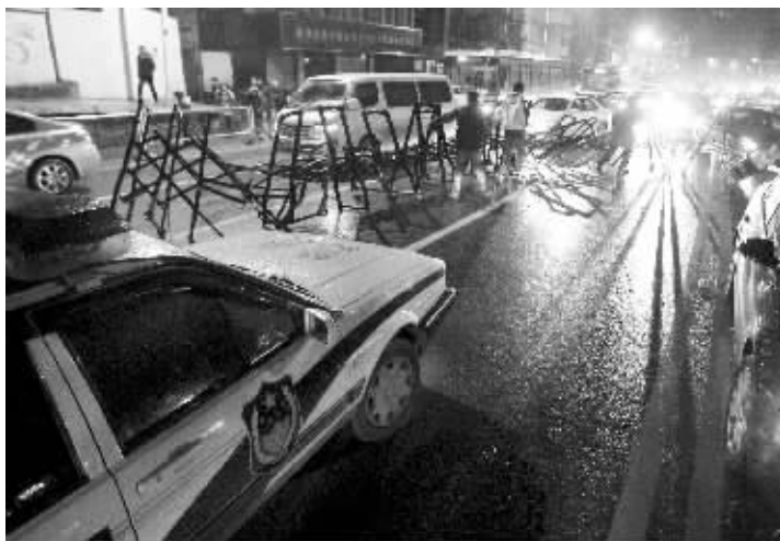
电动门被商务车顶上马路