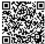
扫描二维码看 现场视频