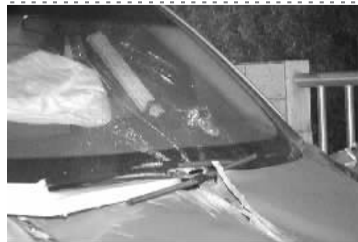
护栏斜插进驾驶室 报料人供图