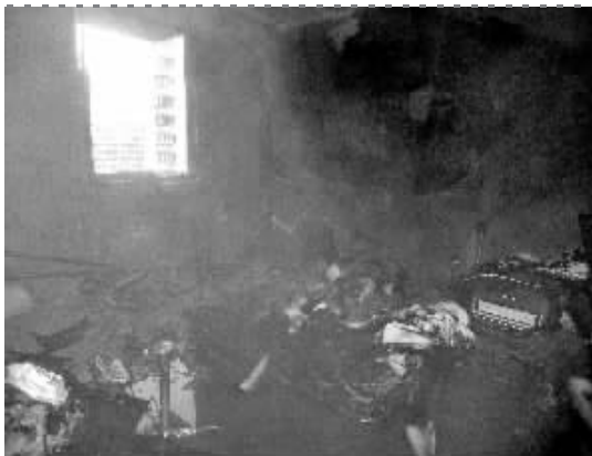
起火的房间几乎烧光了

下午5点多,现场明火被扑灭。失火时主人不在家,邻居们说,住在这里的是租户,应该是外地人,有可能已经回家过年了。居民们分析,起火可能与电线或电器有关。(周先生线索费50元)