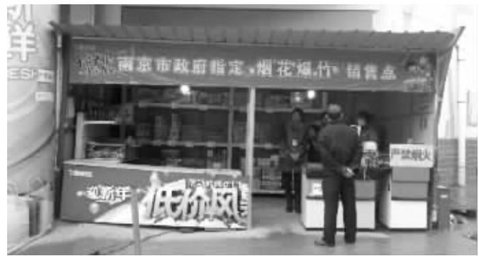
烟花爆竹销售首日遇冷

如果你愿意响应倡议,或者有更好的想法,请拨打现代快报热线96060。现代快报记者是钟寅 常毅