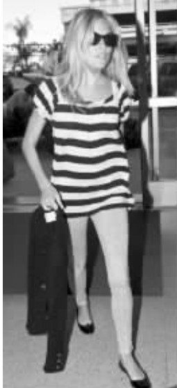
Legging长得跟秋裤差不多,在欧美很受欢迎

Legging其实多年前就在欧美崭露头角。它到底是怎么来的,众说纷纭。有一种传闻是,莱京爵士发明了Legging。莱京爵士1938年出生于美国一个上等阶层家庭,1962年遵父母之命进入牛津大学,学习雄辩术和玄学,然而他对两者兴趣甚少,所有精力都放在研究弹性面料上。他潜心研