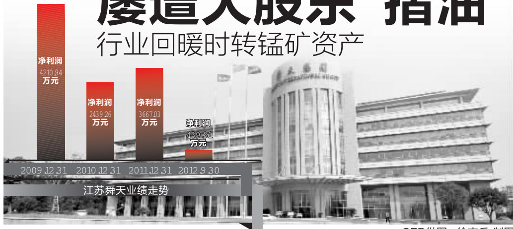
徐文兵 制图

1月31日,江苏舜天突然宣布,以5282万元的价格向控股股东舜天集团转让全资子公司舜天西投100%的股权,理由是“转让与主业关联度不高的参股公司股权”。