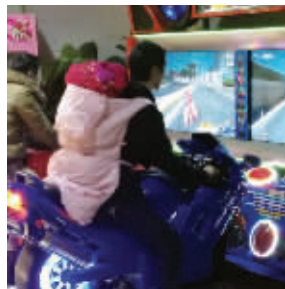
千万别让男人带孩子