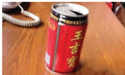
为什么不叫“王加宝”