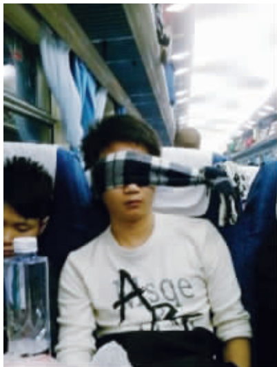
简单一招让旅途不累