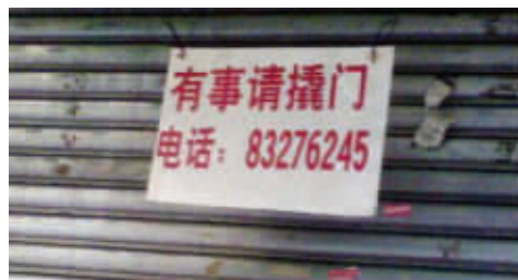
大哥,警察会抓我的