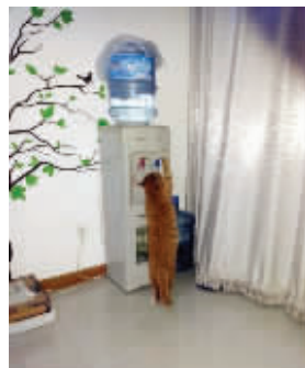
这猫喝水从来不用碗