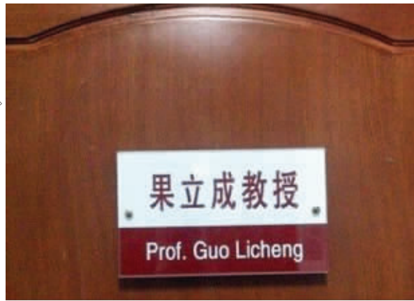
是研究果汁制作技术的么