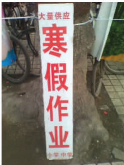
做生意也要讲点良心啊