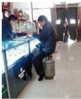
换煤气途中想买个手机