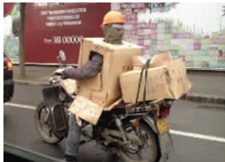
下雨天偶遇“神装备”