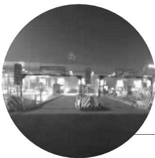
收费站道口已架起“限高门”