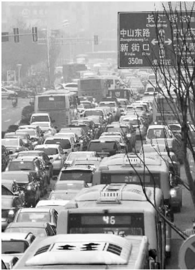
南京街头再次出现“年堵”

春节假期就要来了。今明两天,也是节前的最后一个双休了。忙碌了一年的市民,很多会选择这两天来采购年货,购买新衣服。可以预见,这个双休的堵车将会是一团糟,“年堵”达到了最高峰。 通讯员 宁交轩 刘艳宇 现代快报记者 朱俊俊