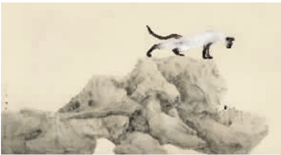
喻慧《猫和蜘蛛——偶遇》