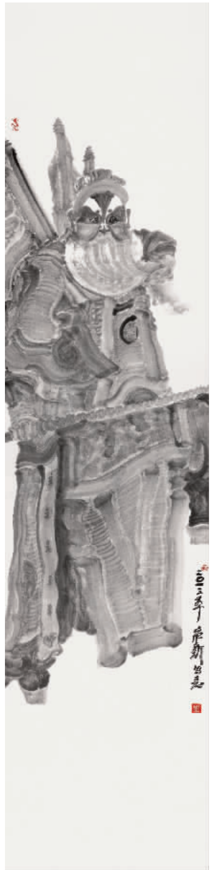
周京新《角色系列之一》

“展览如此受到欢迎，一是国家和政府现在都很重视文化建设，二是江苏人文底蕴非常深厚，拥有优秀的文化传统；第三，老百姓也渐渐开始关注艺术，画家的作品都有着各自的个性，能够带给人们一种耳目一新的感觉，吸引了不同的审美需求。”周京新说，“我们希望每年都能做得更好，加强与广大民众互动交流，希望能打造成文化惠民的实在工程，为江苏文化强省建设作出贡献；同时，把年展品牌项目推广下去，打造成学术品牌，加强艺术服务，为画家与书法家提供更好服务，体现江苏省国画院的新气象和新发展。”