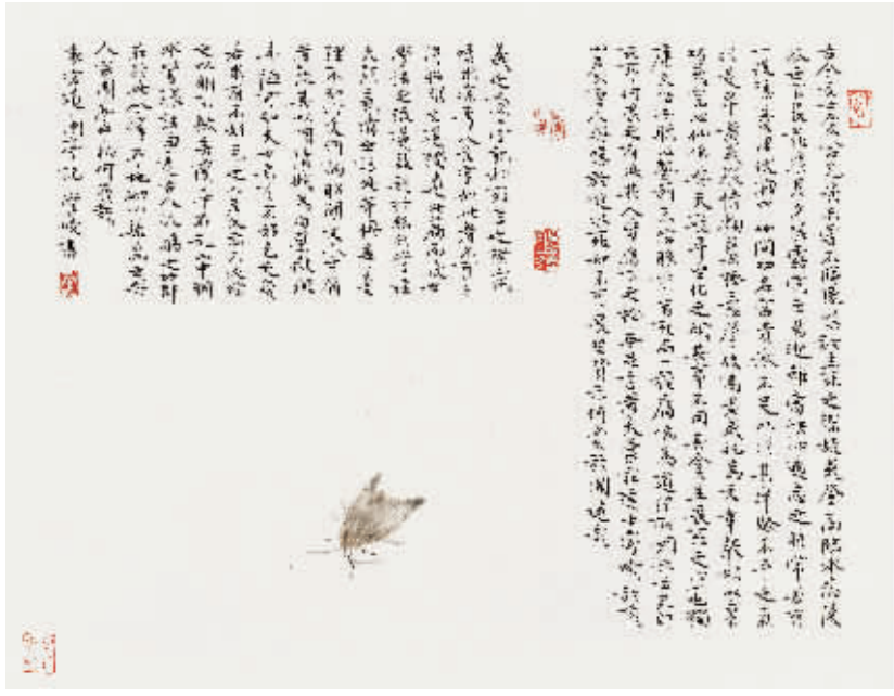
管峻《袁宏道小品文》